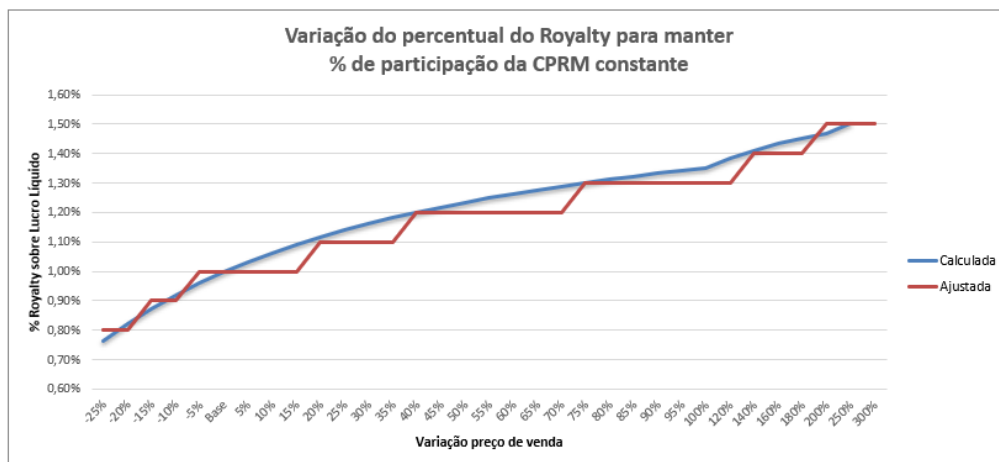
Figura 02. Gráfico de variação do valor de royalty a partir do preço de venda do minério.

Visando a simplificação da fórmula de reequilíbrio, as faixas de variação foram agrupadas de forma a manter a variação mais próxima do valor real a ser aplicado no percentual de royalty para manter a proporção royalty/lucro líquido constante em 2,12% (Figura 02).