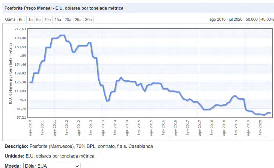
Figura 1. Gráfico da variação de preço do concentrado de fosfato nos últimos 10 anos.

No ano de 2020, o preço do concentrado de fosfato está nos menores níveis dos últimos 10 anos, com média de US$ 73 por tonelada conforme figura 2 1 .