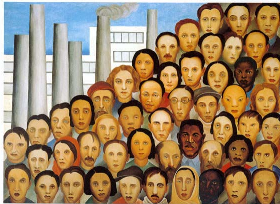
Operários (1933) Óleo/tela 150 X 205cm Col. do Gov. do Estado de São Paulo

Sobre o quadro Operários , pintado em 1933 por Tarsila do Amaral, marque a opção INCORRETA :